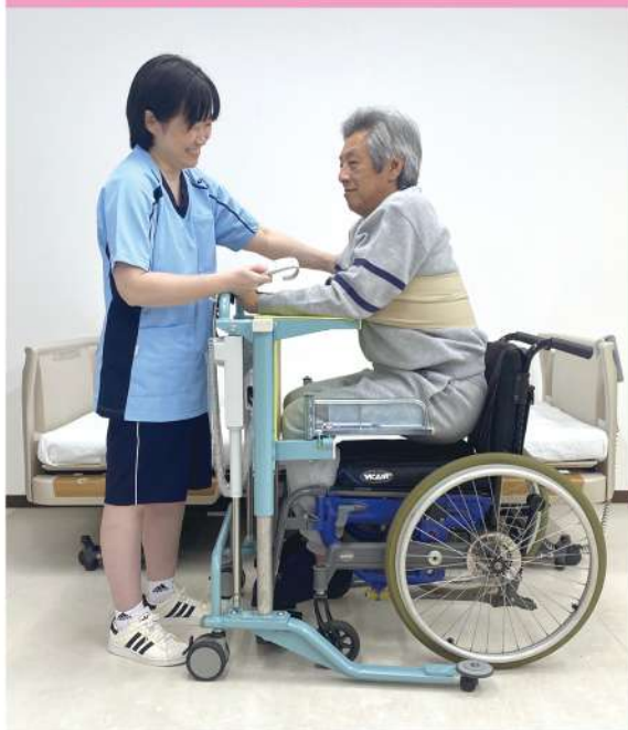
ベッドから車いすへ