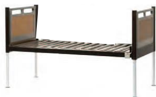
移乗システムセット品 フロアーベッド

脱衣後に、入浴用車いすへ 安全に移乗する為に… 「負担・苦痛のない介助を めざす」介護ロボット 介護者の腰痛予防と、介護され る方の苦痛を緩和